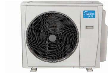
10,6 kW, 12,3 kW